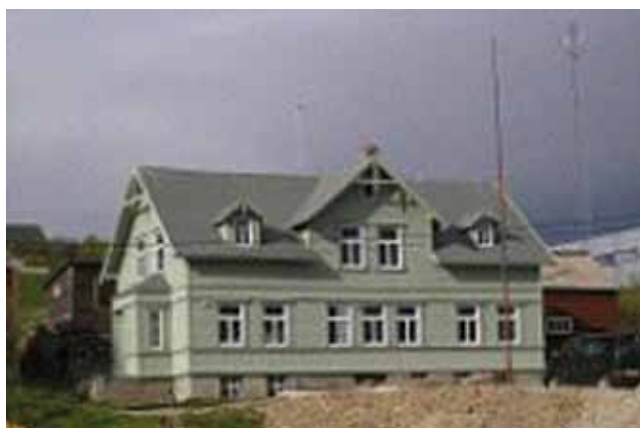
Bietilæ anlegget i Vadsø er en del av Varanger museum

Museet er et interkommunalt selskap mellom Alta kommune og Finnmark fylkeskommune hvor partene eier 50 % hver. Årsaken til at fylkeskommunen har gått inn som eier er forvaltningsansvaret som FFK har i henhold til Lov om kulturminne for bergkunsten i Alta. Oppgaver knyttet til skjøtsel og formidling av bergkunsten er videredelegert fra fylkeskommunen til museet. Museet har eget styre hvor også fylkeskommunen har sin representant.