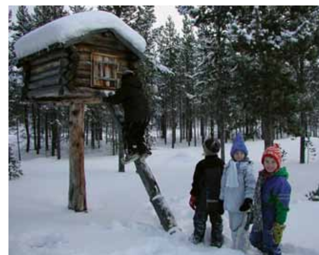
Samisk njalla ved Sámiid-Vuorká-Dávvi / De Samiske samlinger i Karasjok.

Det er en spesielt stor utfordring å ta vare på de over hundre fredete og verneverdige bygninger som er i museenes eie. Statlige finansieringsordninger må på plass for å løse mange av utfordringene knyttet til bygningsarven. Museene eier nesten halvparten av de private arkivene som er bevart i institusjonell sammenheng, og er således største arkiveier i fylket. Arkivsamlinger er et vesentlig kildemateriale for forskning og formidling, og det er viktig at samlingene blir oppbevart forsvarlig og at de blir tilgjengeliggjort for forskning. Det er et åpenbart behov for å se arbeidet med privatarkiv i en større sammenheng, og i et mer forpliktende samarbeid mellom museene og arkivinstitusjonene.