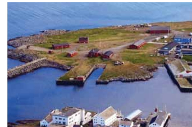
Berlevåg Havnemuseum.

Museene i Finnmark representerer den største faglige ressursen innen kultursektoren i fylket med mange høyt kvalifisert ansatte. Totalt er det 86 årsverk i museene hvorav 12 i lederstillinger, 46 i fagstillinger, 11 i tekniske stillinger og 17 i administrative stillinger. Museene er viktige institusjoner i sine lokalmiljø, men bidrar også i regional, nasjonal og internasjonal sammenheng innen forskning og formidling, og utgjør på denne måten viktige kompetansmiljø i fylket.