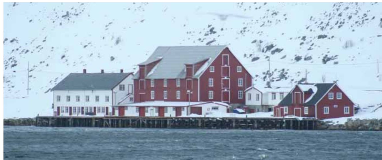
Folldalbruket i Kjøllefjord

Museene for kystkultur og gjenreisning er et IKS mellom kommunene Hammerfest, Måsøy, Nordkapp, Gamvik og Berlevåg. Fra 1.01.17 ble også Folldalbruket i Lebesby kommune en del av dette interkommunale selskapet. Museet har sitt hovedkontor ved Nordkappmuseet i Honningsvåg med avdelinger i de øvrige kommunene.