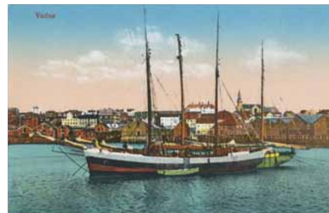
Postkort av pomorskute på Vadsø havn ca 1900.

Flere av museene sliter med umoderne og utrygge magasin og oppbevaringsforhold, det gjelder blant annet Museene for kystkultur og gjenreisning, Varanger Museum avd. Vardø og ikke minst de samiske museene som trenger nye magasin for å kunne ta i mot gjenstandsmateriale som skal overføres fra Norsk Folkemuseum igjennom Bååstede prosjektet.