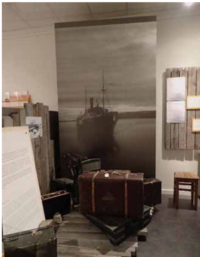
Fra utstilling i Gjenreisningsmuseet for Finnmark og Nord-Troms.