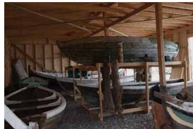
Båtsamling fra Kokelv museum