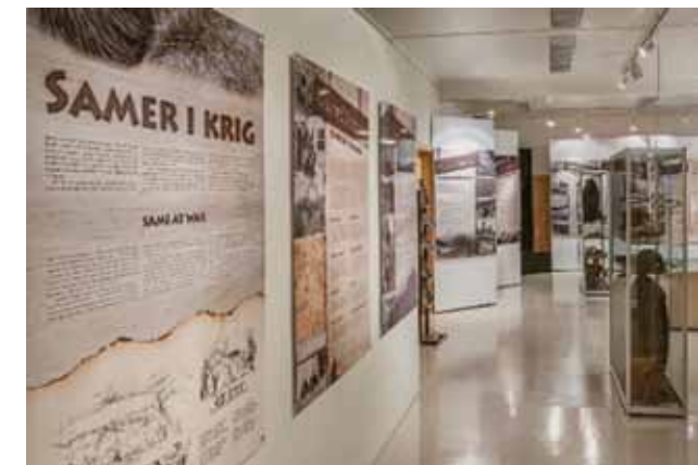
Utstilling ved Sámiid-Vuorká-Dávira/De samiske samlinger