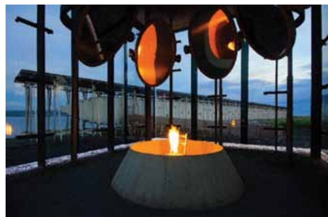
Steilneset minnested i Vardø er en del av Varanger museum

Varanger museum er et IKS mellom kommunene Vardø, Vadsø og Sør-Varanger. Museet har sitt hovedkontor i Vardø i tilknytning til Vardø museum med avdelinger i Vadsø og Sør-Varanger. Varanger museums hovedtema er grensehistorie inkludert 2. verdenskrig, kvenenes historie, pomorhistorie, partisanhistorie samt Vardø bys historie inkludert Vardøhus festning og Steilneset minnested.