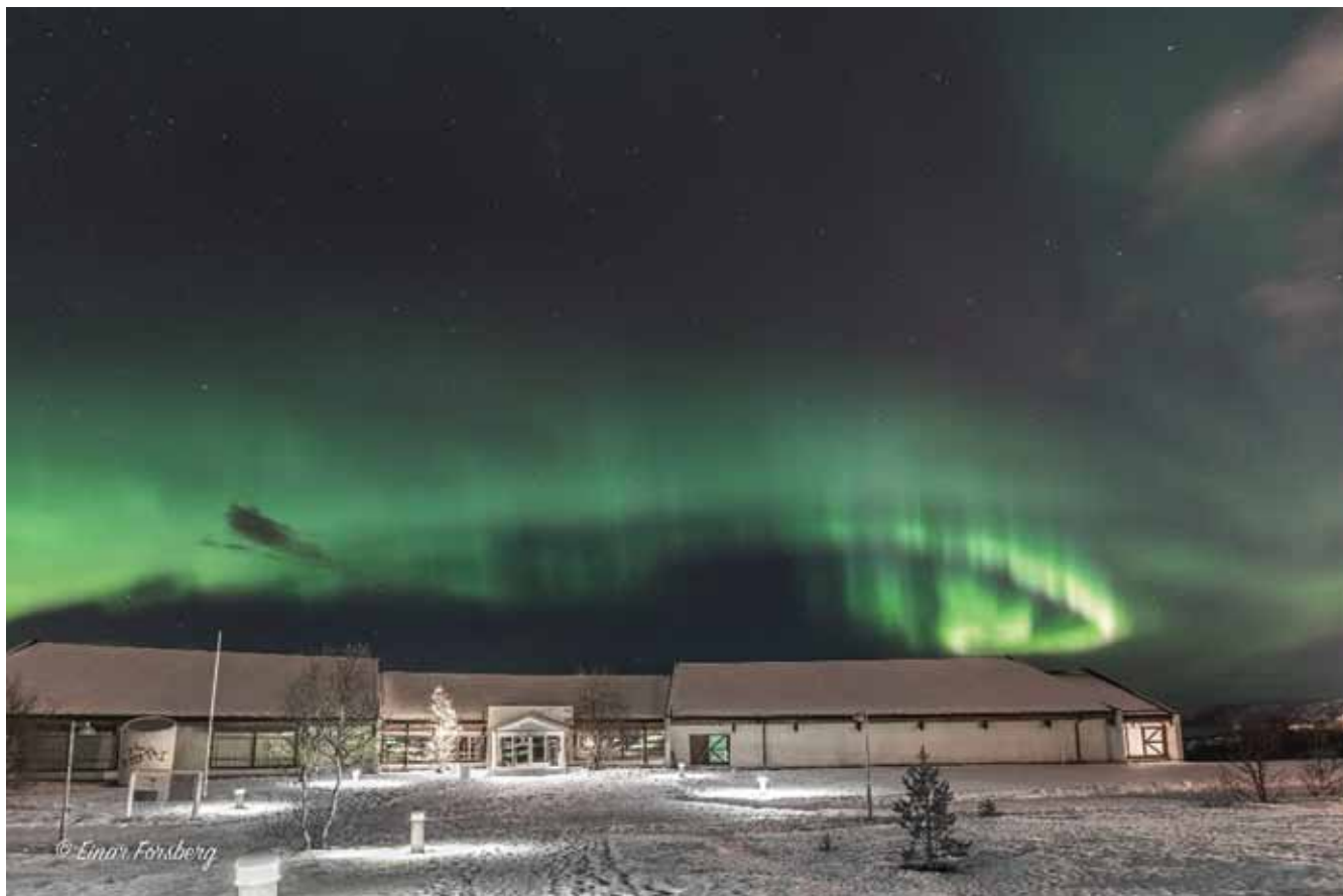
Verdensarvsenter for bergkunst-Alta museum.