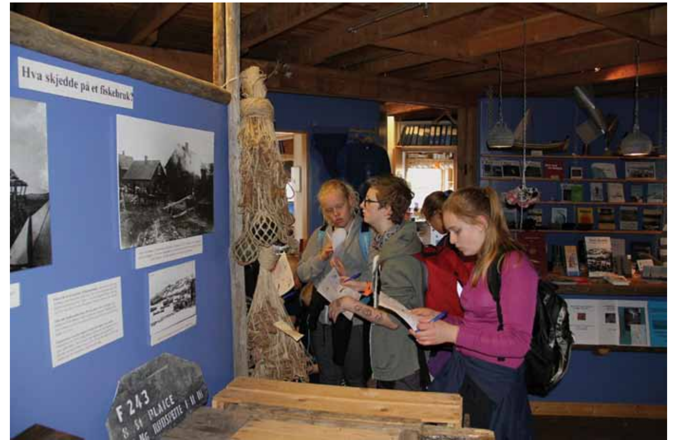
Elevbesøk på Gamvik museum.