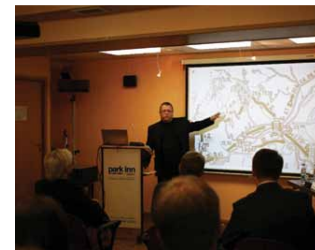
Fra norsk/russisk konferanse i Murmansk i forbindelse med 70 års jubileet for frigjøringa i 2014.

Museene må selv være aktiv i forhold til å etablere nettverk som kan gi faglig gevinst både på lang og kort sikt. Fylkeskommunens rolle og funksjon er å informere om muligheter og være døråpner i forhold til kontakter og nettverk gjennom de formelle avtalene som vi forvalter.