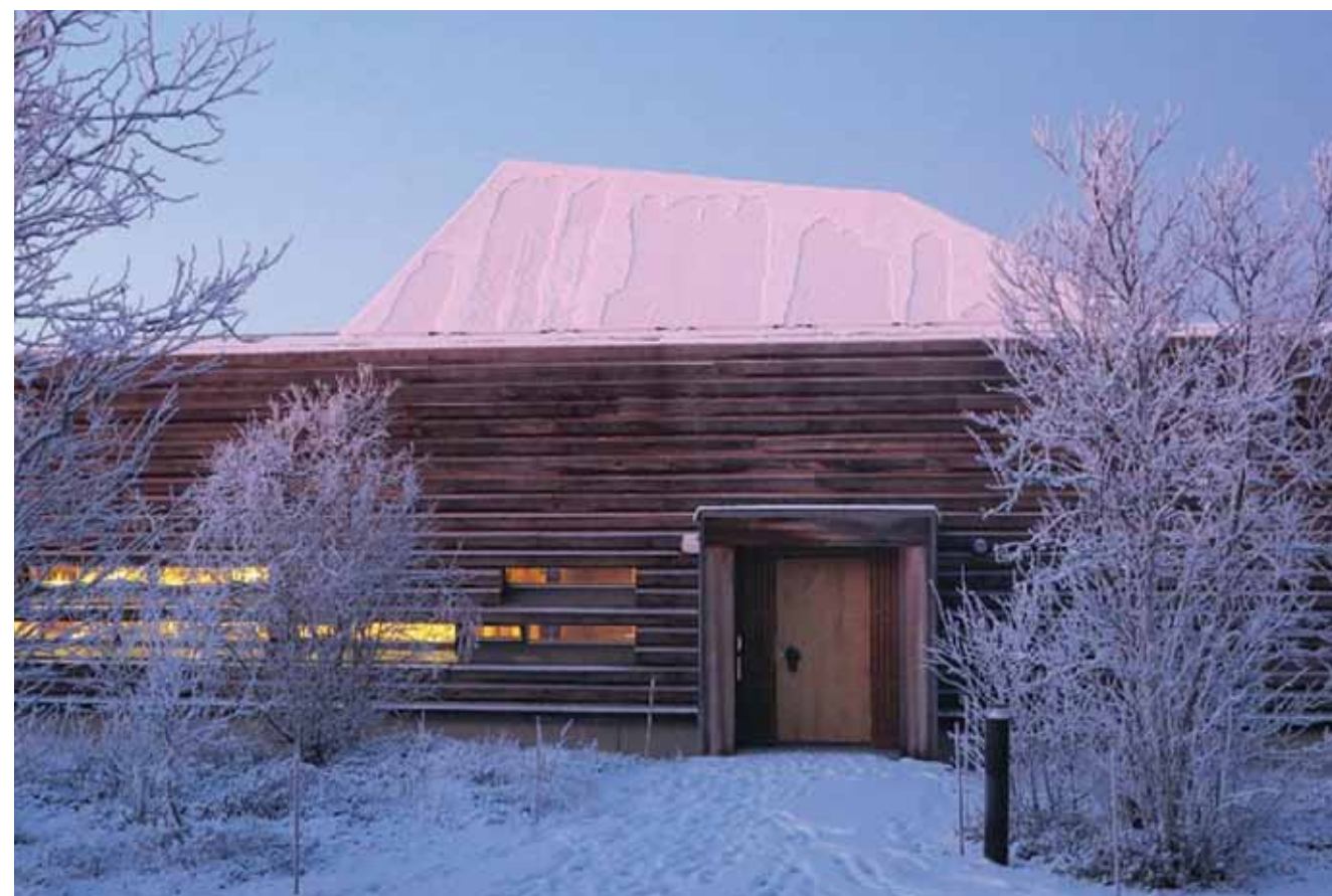
Øst samisk museum i Neiden, Øst samisk museum/Tana og Varanger museumsiida.

Museet er en stiftelse bestående av Tana museum, Varanger samiske museum, Skoltesamisk museum i Neiden og Saviomuseet i Kirkenes. Museets hovedkontor ligger i Varangerbotn ved Varanger samiske museum. Museet har fått delegert ansvar for Mortensnes kulturminneområde. Skoltesamisk museum i Neiden åpner for publikum i juni 2017.