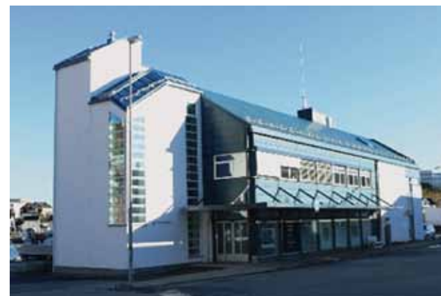
Nytt museumsbygg i Honningsvåg.