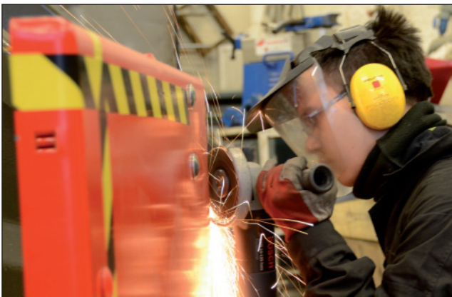
Gáldu: Regionála plánastrategiija 2012- 2016, Finnmárkkus fylkkagiela

Finnmárkkus fylkkagiela háliida ahte oahppanáigi fitnodagas galgá addit buori kvalitehta oahpahasas. Fágalaš jodiheadji/bagadalli galgá čuovvolit buriin máhtolašvuodain oahppoplánamihtuid birra ja buriin láchčimiin. Oahppoáigi galgá addit fidnooahppiide mávssolaš gelbbolašvuoda, nu ahte sii