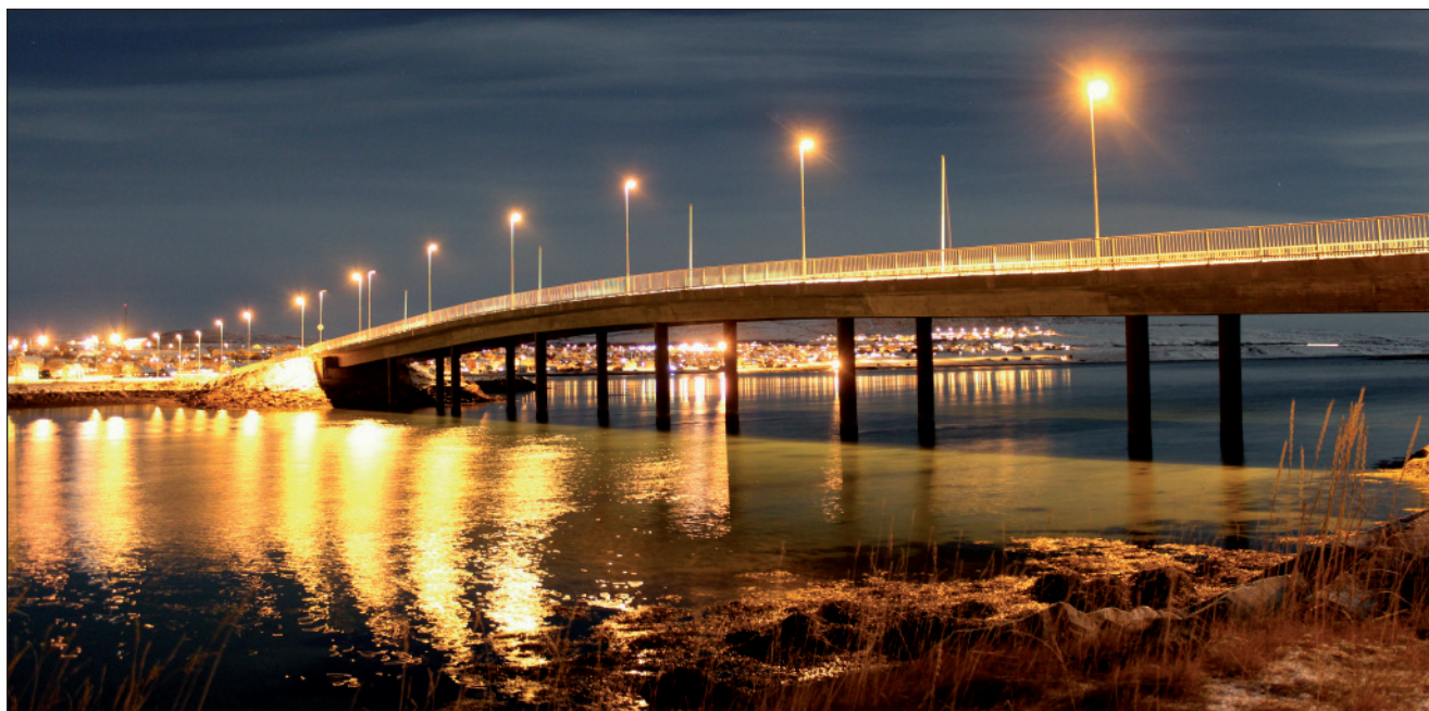
Finnmárkkus regionála gelbbolašvuodaplána galgá láhčit dili oaidnit oahppomannolaga oktavuodas.

Oahpahusa mánggabealat hástalusaid sáhtta čoavdit go bidjá nu ahte Finnmárkkus galgá leat geatnegahtton ovttagu gaskal oahpahusaktevraid.