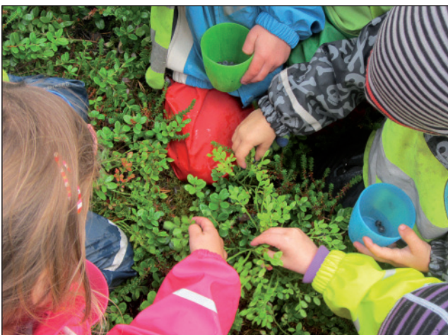
Govva: Álttá suohkan

Mánáidgárdi galgá addit mánáide buori álggu eallimis, ja addit buori vuodá boahteáiggi servodaga searvamii ja leat álgun máná eallinagi oahppannannolahkii, beroškeahtá duogážiis ja dárbbuin. Dát gáibida ahte mánáidgárdi árrat bargagoahtá hástalusaiiguin, láchčá dili buriid oahppan- ja ovdánanvejolašvuodaide ja heiveha mánáidgárdefálaldaga ovttaskas máná dárbbuide.