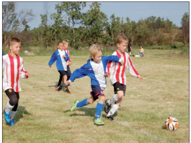
Fysalaš doaimma eastada 33 eallinvuohkedávdda. .