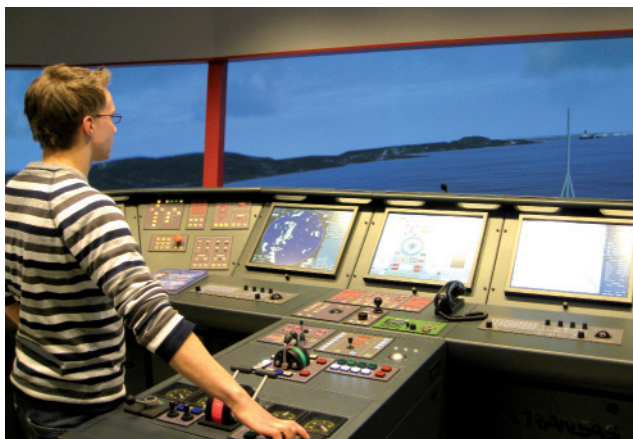
Davvenjágga maritiima fágaskuvlla simulatuvra vejolažžan dahká oahpahusa, ealáhusovdáneami ja innovašuvnna maritiimma ealáhusain

Fylkkagielda galgá fuolahit ahte fálljuvvo dohkkehuvvon fágaskuvlaoahpahus mii vuhtiiváldá báikkálaš, regionálalaš ja našuvnalaš gelbbolašvuodárbbuid vuoruhuvvon servodatsurggiin. Fágaskuvlafálaldat lea oassin Norgga goalmát oahppodásis, ja galgá fágaskuvlalága vuodul addit oanehis fidnooahpuid, madda vuodđun lea joatkkaoahpahus dahje vástideaddji reálagelbbolašvuotta, ja oahppojahki das galgá bistit unnimusat jahkebeali ja eanemusat guokte jagi.