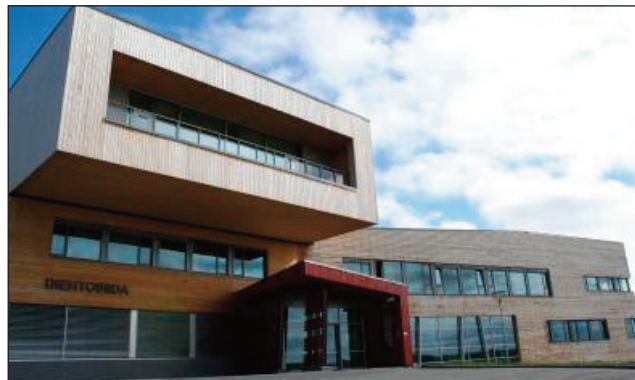
Sámi allaskuvla Guovdageainnus

Finnmárkkus lea Sámi Allaskuvla guovddášásahus alit ohppui sámi máhttodárbbu várás. Dát lea dehálaš bargu mii boahdá leat vuodđogeadgin dasa ahte viidásetovdánahttit buriid oahpuid mat dustejit sámi servodaga máhttodárbbuid.