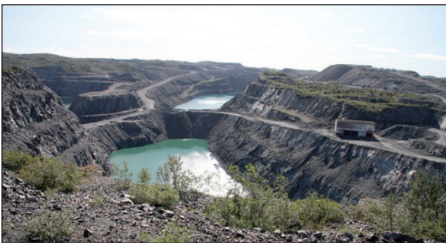
Finnmárku lea gelddolaš minerála fylka stuora duodašuvvon minerálaressaiguin. Guovžajávri ruvke.

Fágaskuvla leat fidnofágalaš oahput madda vuodđun lea joatkkaoahpahas dahje vástideaddji reálagelbbolašvuhta. Oahpuin lea oahppojahki mii bistá jahkebeali rájes guovtti jahká, ja dat leat oassin tertiálaoahpus. Dat mearkkaša ahte oahppu mii lea dásis joatkkaoahpahas bajábealde. Fidnofágalaš oahpuin oavvilduvvo oahppu mii addá gelbbolašvuoda maid sáhtá geavahišgoahtit bargoeallimis vel eanet obbalaš oahpahasdoaimmaid haga. Fágaskuvllain lea dehálaš doaimma leat "vásedin doaimmaid" fáluheadjtin bargoeallimii, ja sii leat stuora lágideaddjit lass- ja joatkkaoahpuin. Finnmárkkus lea fágaoahpahas nanus, ja fágaskuvla lea dehálažžan fidnogelbbolašvuoda vel eanet nanemii. Fágaskuvllat leat dehálaš lágideaddjit gelbbolašvuodas maid ealáhusdoaimmat ohcalit.