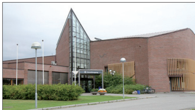
Romssa Universitehta – Norgga ártkalaš universitehta, Campus Áltá

Áltá, Hámmárfeastta ja Girkonjárdga Campusat UiT-Norgga ártkalaš universitehta bokte leat mutuvrrat oahpuin norgga servodaga váste, ja leat ovttas Sámi Allaskuvllain dehálaš doaimmat fátmastit sámi dimenšuvnna buot alit oahpuin Finnmárkkus. Regionálalaš perspektiivvas boahtiba earenoamážit UiT-Norgga ártkalaš universitehta ja Sámi Allaskuvla leat dehálaš ovttasbargoguoibmin dustet daid hástalusaid mat sámi oahpposervodagas odne leat.