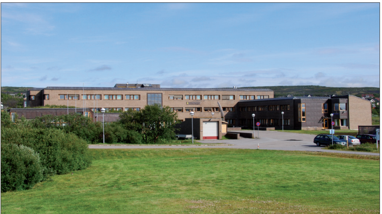
Fylkkaviessu, N-9800 Čáhcesullo.