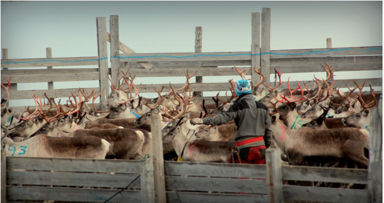
Finnmárkkus leat earenoamáš ja mánggalágan álgoávdnasat árbevieru, kultuvrra, dálkkádaga, birra ja luonddu ektui.