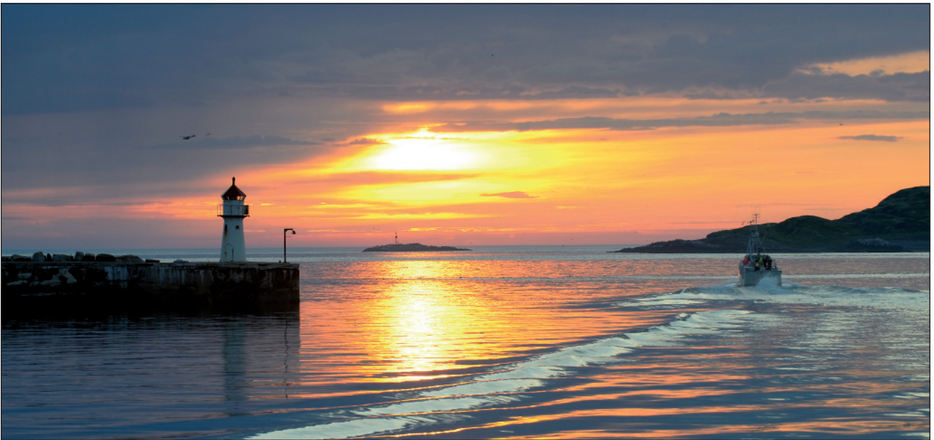
Finnmarkku regionála gelbbolašvuođaplána ráhkademiin jurddašuvvo guhkesáigásaččat ja dasto váikkuha nanneme einnos-tahttivuođa Finnmarkku ealáhusdoaimmaide.