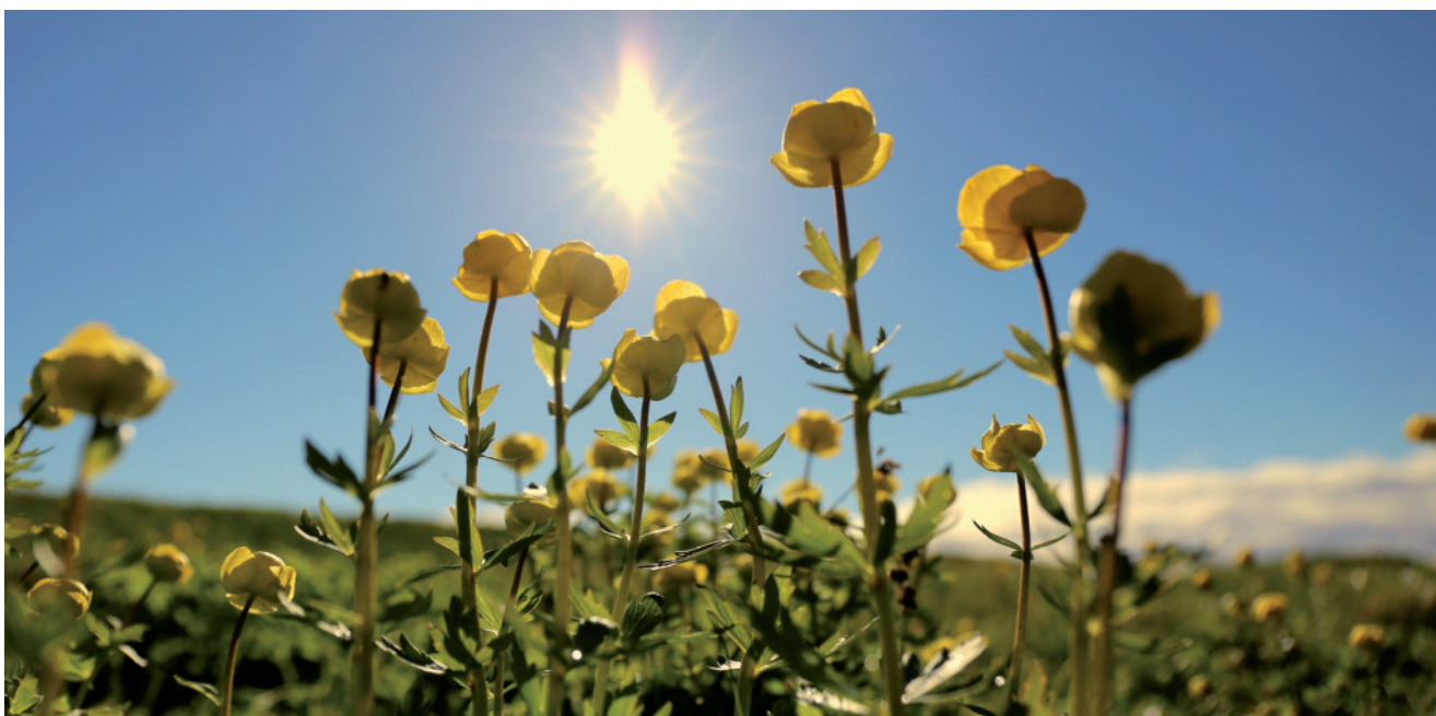
Gowva: Odd Angell